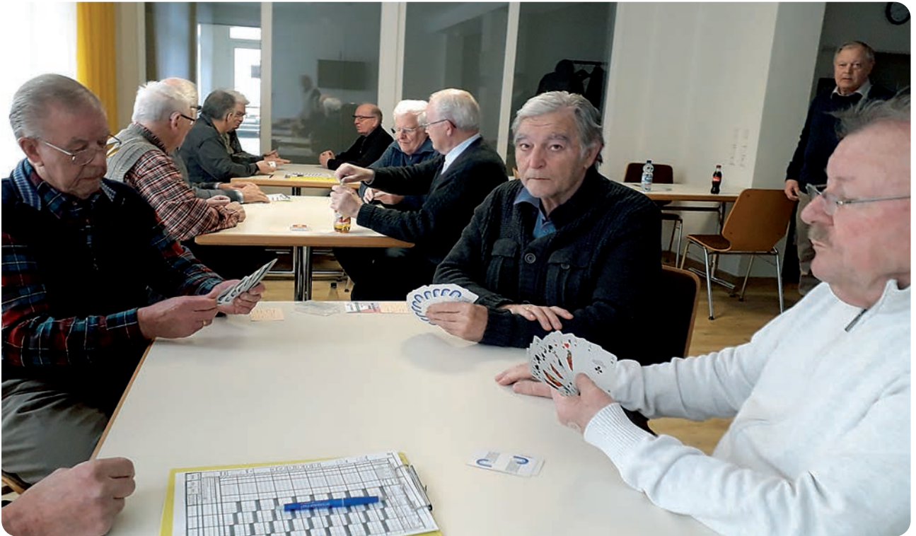
Skatrunde in der Begegnungsstätte