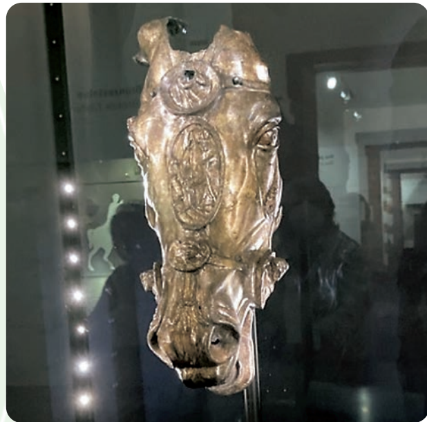
Der goldene Pferdekopf

Die Spenderinnen und Spender der Aktion „Wünsch Dir was“ von Bürgerstiftung und Offenbach Post schenkten den Ehrenamtlichen und Gästen des BV Götzenhain einen wunderschönen Ausflug zur Saalburg. Am 30. 9. 2022 konnten wir dank kundiger Führung unter anderem viel über die Römerzeit, römisches Handwerk, Legionärskohorten, römischen Städte- und Straßenbau, Küchenkunst, Innenarchitektur und sonstige Alltagsgepflogenheiten der Römer erfahren.