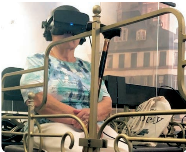
„Timeride“ auf Zeitreise

Ihre Senior*innenarbeit der Stadt Dreieich