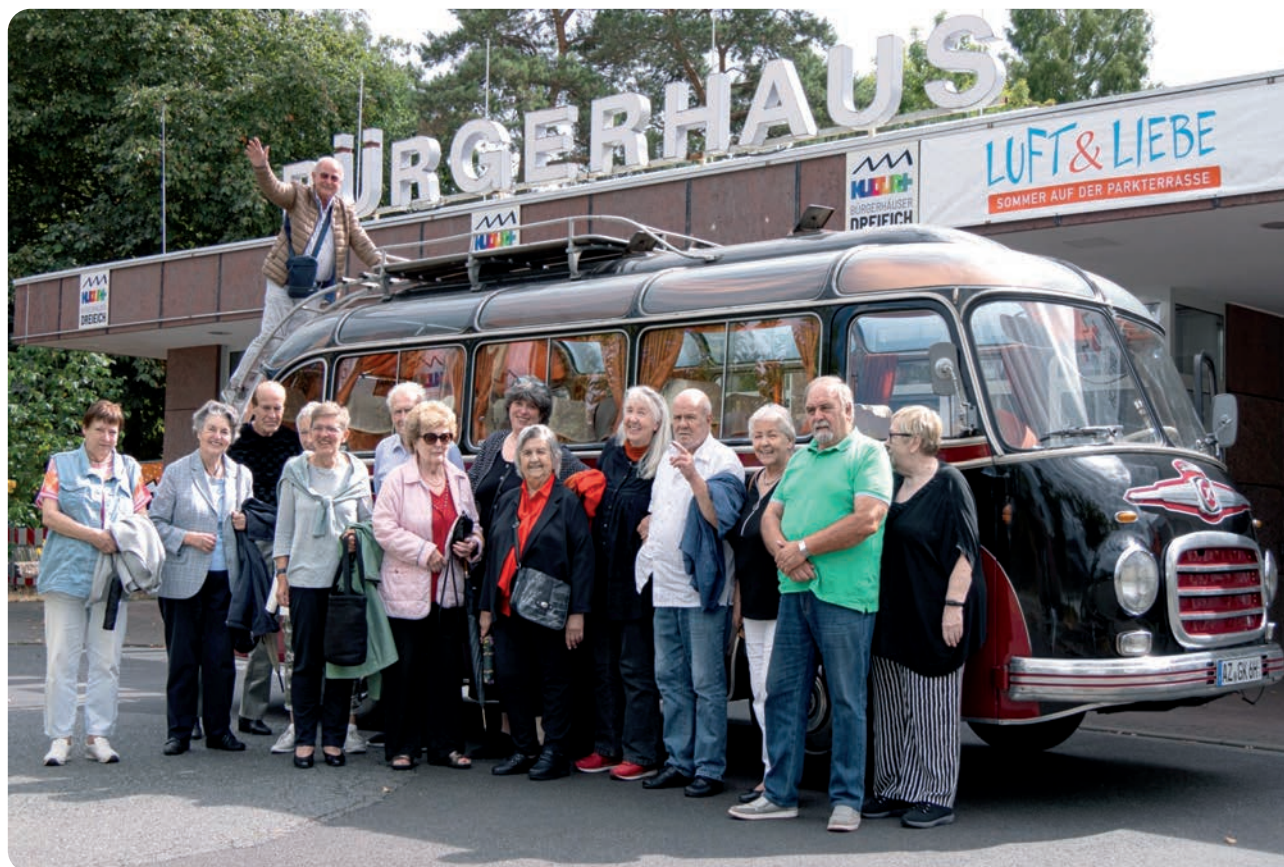
Mit dem Oldtimer-Bus ging es ab nach Frankfurt.