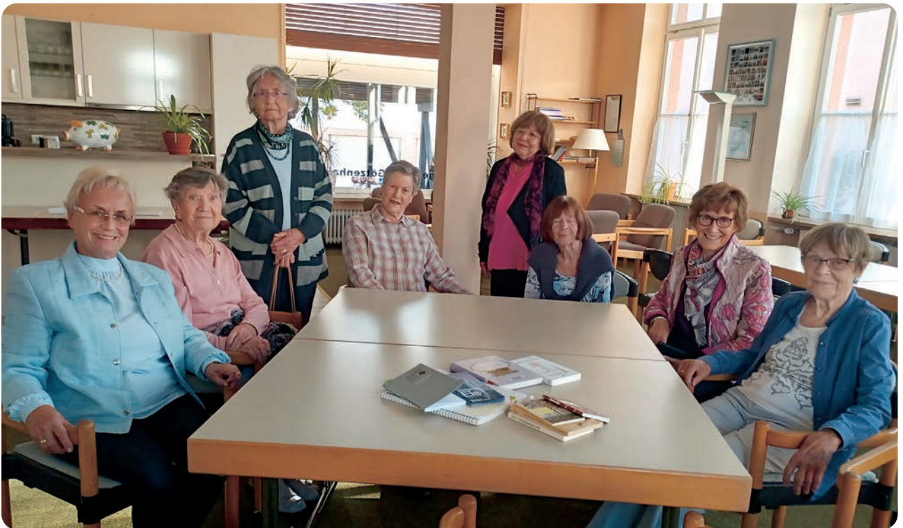
Teilnehmerinnen des Literaturkreises im Bürgertreff Götzenhain