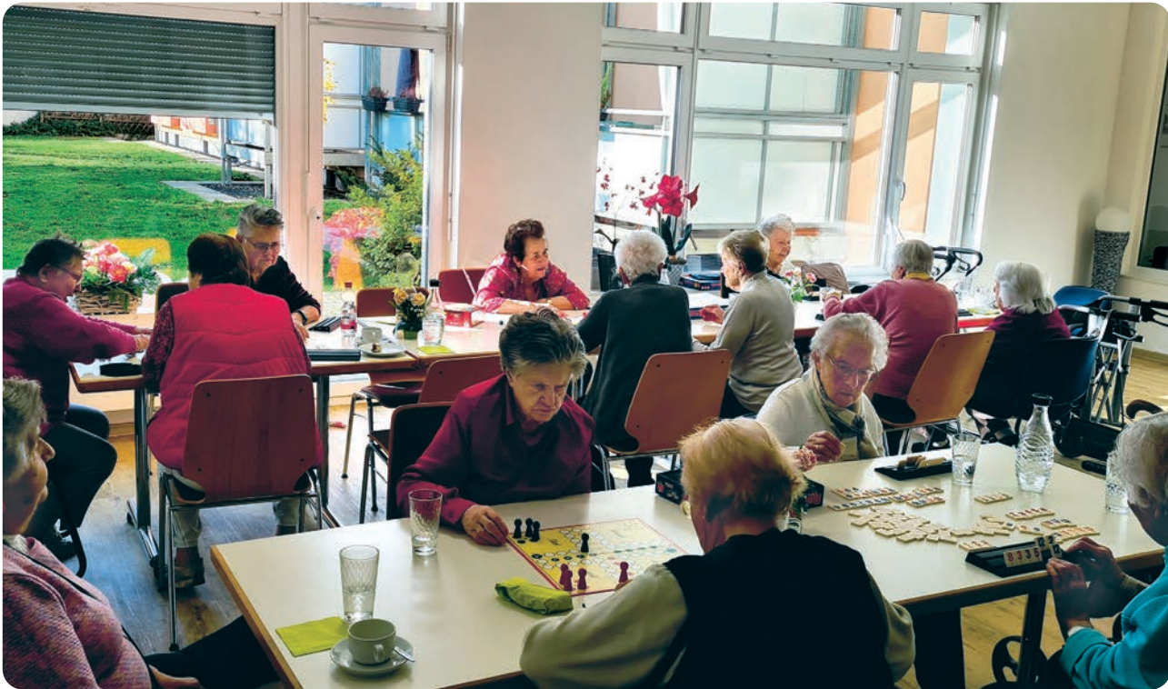
Spiele-Nachmittag in der Begegnungsstätte