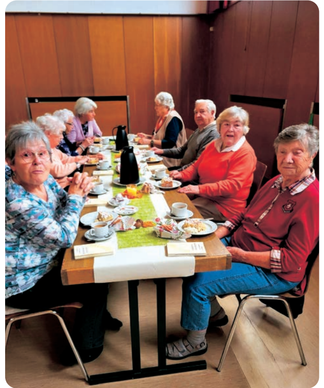
bei Speis und Trank