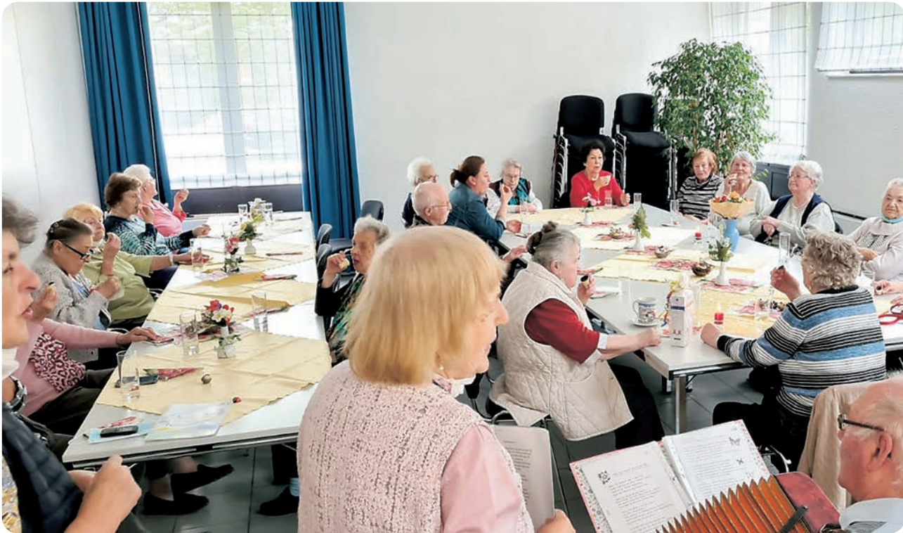
„Mit Musik geht alles besser“. So wurde u.a. das 50-jährige Jubiläum im April gefeiert