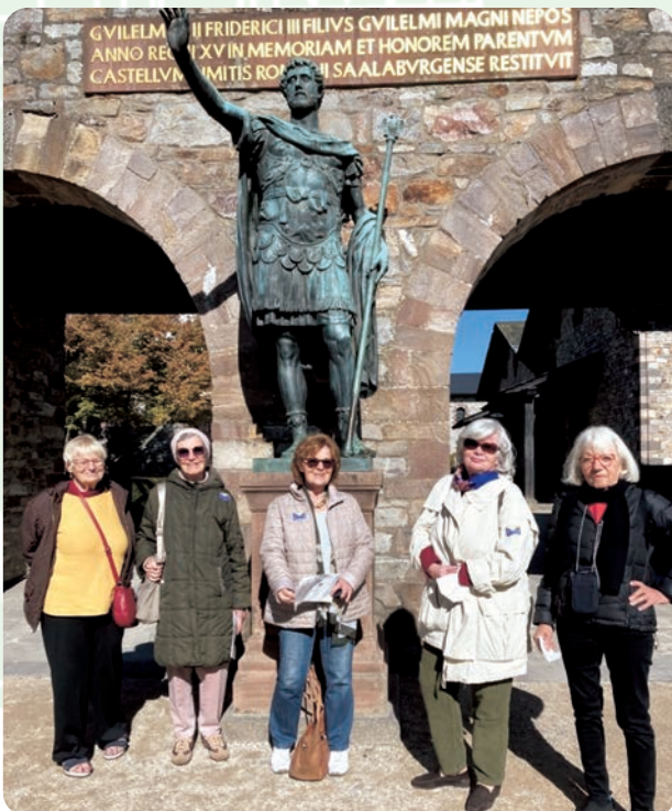
Auf der Saalburg

DANKE für die schönen Stunden. Christiane Jaeger