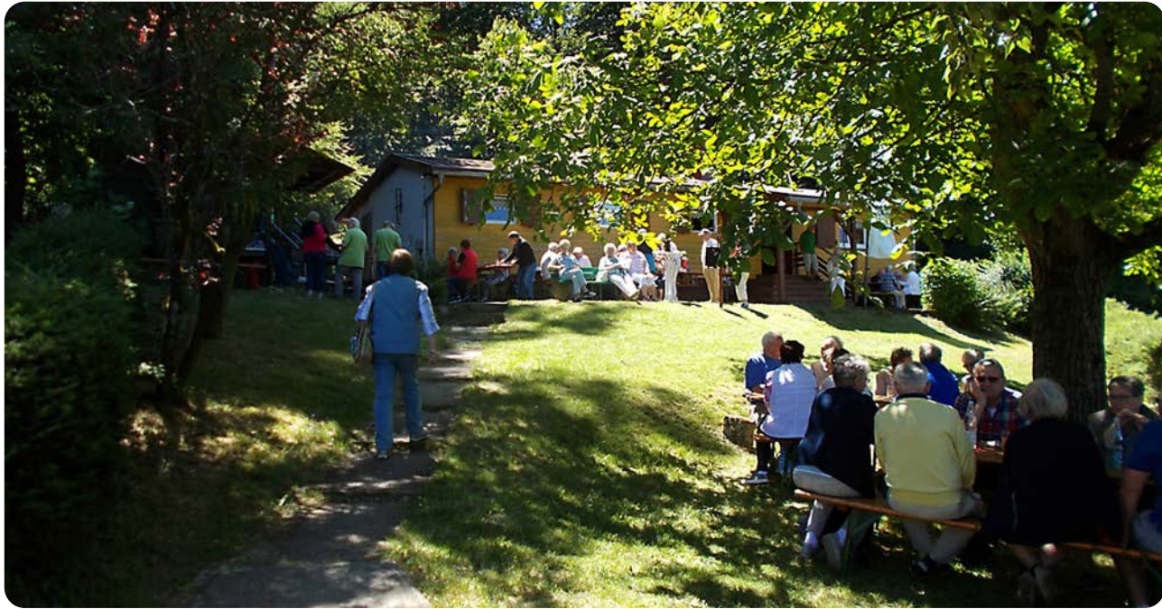
Klubhaus und Außenanlage