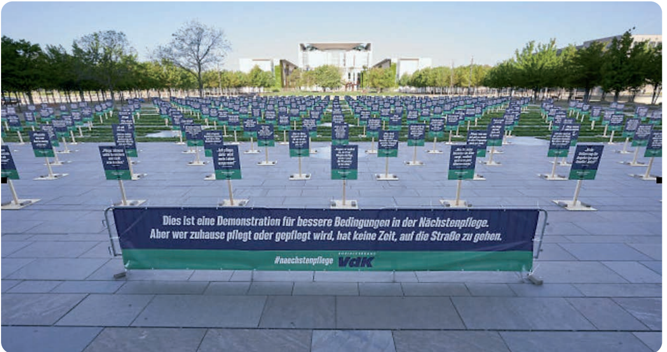
„Demo ohne Menschen“