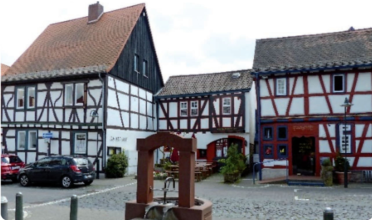
Die Gut Stub in Dreieichenhain